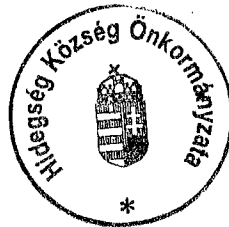
Dévényi Zoltánné polgármester