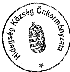
Dévényi Zoltánné polgármester