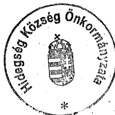
Dévényi Zoltánné polgármester