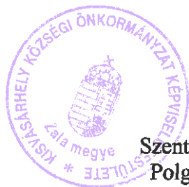
Szentmiklóssi Erzsébet Polgármester