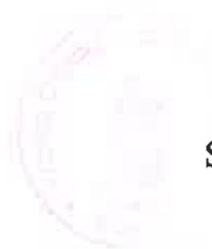
Szabó Ferenc polgármester